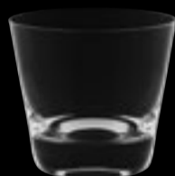
Cocktail 15 40 cl 13 ½ oz H 93 mm 3 ¾ " D 104 mm 4 " No. 4836 1500