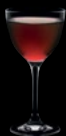
Nick & Nora 04 16 cl 5 1/2 oz H 150 mm 6" D 74 mm 3" No. 6515 0400