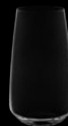
Bicchiere HB 12 50 cl 17 oz H 145 mm 5 ¾ " D 84 mm 3 ¼ " No. 65856 1200