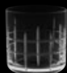
OF Montgomery 16925 37 cl 12 ½ oz H 85 mm 3 ¼" D 85 mm 3 ¼" No. 8077 H / 16925