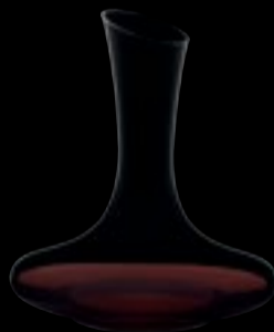
Decanter 75 A