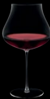
CALICE I VINI ROSSI DA VITIGNI COLORANTI E TINTOREI

90.5 cl 30 ½ oz H 235 mm 9 ¼" D 126 mm 5"