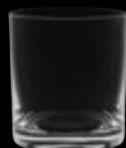
Bicchiere OF 16 28 cl 9 ½ oz H 88 mm 3 ½ " D 80 mm 3 ¼ " No. 4232 1600