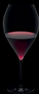
Calice vino 01