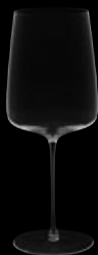
Acqua 01 68 cl 23 oz H 245 mm 9 ¾ " D 95 mm 3 ¾ " No. 64900 A 0100