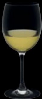
Calice vino 01 35 cl 11 3/4 oz H 195 mm 7 1/2" D 85 mm 3 1/2" No. 6200 0100