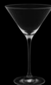
Coppa martini 28 21 cl 7 oz H 183 mm 7 1/4" D 112 mm 4 1/2" No. 6006 2800