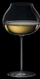
CALICE I VINI BIANCHI PIU' GRANDI DEL MONDO

76 cl 25 ¾ oz H 224 mm 8 ¾" D 120 mm 4 ¾"