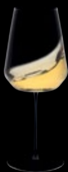
Calice vino 02 39 cl 13 ¼ oz H 217 mm 8 ½ " D 87 mm 3 ½ " No. 65856 0200