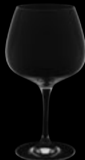
Borgogna 10 68 cl 23 oz H 210 mm 8 1/4" D 114 mm 4 1/2" No. 6050 1000