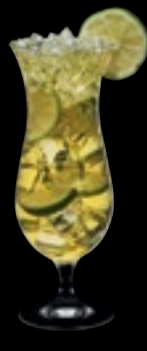
Longdrink "Hurricane" 33 46,5 cl 12 1/4 oz H 208 mm 8 1/4" D 78 mm 3" No. 6050 3300