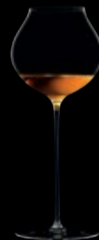
CALICE VINO ORANGE