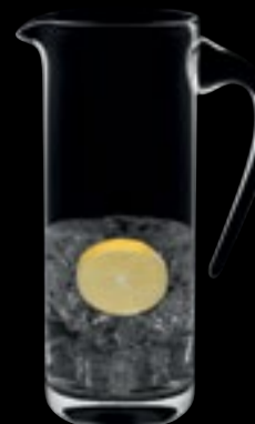
Brocca 49 100 cl 33 ¾ oz H 255 mm 10" D 115 mm 4 ½" No. 61534 A 4900