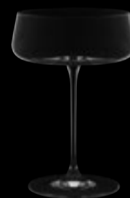
Coppa champagne 08

42,5 cl 14 ¼ oz H 170 mm 6 ¾" D 120 mm 4 ¾"