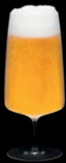
Calice birra 19 49 cl 16 ½ oz H 185 mm 7 ¼" D 80 mm 3" No. 64900 A 1900