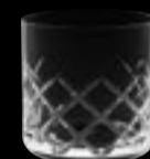
OF Knox 16076 37 cl 12 ½ oz H 85 mm 3 ¼" D 85 mm 3 ¼" No. 8077 H / 16076