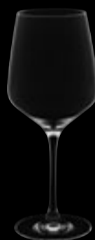
Calice vino 01 51 cl 17 ¼ oz H 230 mm 9" D 96 mm 4" No. 6103 0100