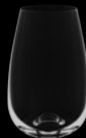
Bicchiere HB 122 66 cl 22 1/4 oz H 140 mm 5 1/2 " D 93 mm 3 3/4 " No. 4245 1220