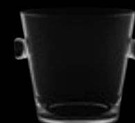
Secchiello ghiaccio 91 H 130 mm 5 ⅙" D 138 mm 5 ⅝" No. 2823 9100

↳ Calibrazione disponibile su richiesta come indicato nel listino prezzi