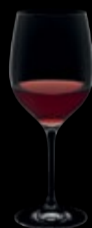
Calice vino 01 45 cl 15 ¼ oz H 220 mm 8 ¾" D 88 mm 3 ½" No. 6050 0100