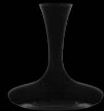
Decanter 70 35 cl 11 3/4 oz H 150 mm 6 " D 144 mm 5 1/2 " No. 2819 7000

— Calibrazione disponibile su richiesta come indicato nel listino prezzi