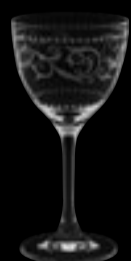
Nick & Nora satinato 16 cl 5 1/2 oz H 150 mm 6" D 74 mm 3" No. 6515 04925

La gamma Classic Cocktail è stata ricreata con gli stampi originali che hanno dato vita ai bicchieri utilizzati negli anni '30 in famosi locali come Rainbow Room e che hanno reso immortale il cocktail Manhattan. Queste forme classiche hanno resistito alla prova del tempo ed hanno riacquisito importanza nel segmento mixology, oggi in forte crescita.