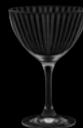
Coppa champagne Optik 25 cl 8 1/2 oz H 144 mm 5 3/4" D 98 mm 4" No. 6515 P 0800