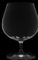
Brandy 18 40 cl 13 1/2 oz H 138 mm 5 1/2" D 95 mm 3 3/4" No. 6201 1800