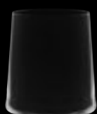
Bicchiere OF 16 54 cl 18 ¼ oz H 100 mm 4 " D 95 mm 3 ¾ " No. 64955 1600