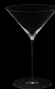
Martini 28 34 cl 11 ½ oz H 190 mm 7 ½ " D 130 mm 5 " No. 64900 A 2800