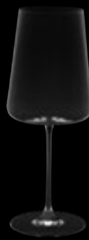
Bordeaux 00 68 cl 23 oz H 250 mm 9 3/4 " D 98 mm 3 3/4 " No. 7048 0000