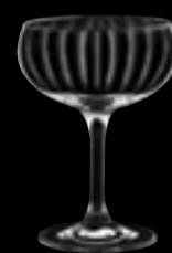
Paris Coppa champagne Optik 26 cl 8 3/4 oz H 131 mm 5 1/4" D 96 mm 3 3/4" No. 6515 P 2800

Calibrazione disponibile su richiesta come indicato nel listino prezzi