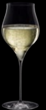
CALICE I VINI SPUMANTI