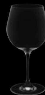
Borgogna 10 61 cl 20 ¾ oz H 213 mm 8 ½" D 105 mm 4" No. 6265 1000