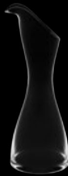
Caraffe Jabiru 74