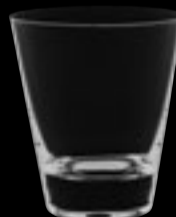
Double old fashioned 166 33 cl 11 ¼ oz H 105 mm 4 ¼ " D 92 mm 3 ½ " No. 4836 1660