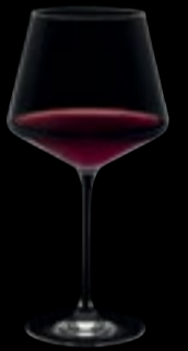
Borgogna 10 73 cl 25 oz H 230 mm 9 " D 118 mm 4 3/4 " No. 6829 1000