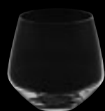
Bicchiere OF 16

39 cl 13 ¼ oz H 90 mm 3 ½ " D 95 mm 3 ¾ "