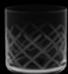
OF Diamond 16180 37 cl 12 ½ oz H 85 mm 3 ¼" D 85 mm 3 ¼" No. 8077 H / 16180