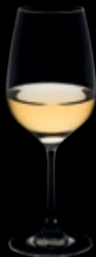
Calice vino 01