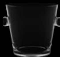
Secchiello ghiaccio 91