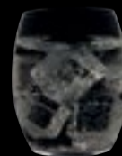
Juice tumbler 15

35 cl 11 ¾ oz H 95 mm 3 ¾ " D 80 mm 3 ¼ "