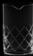
Mixer Cumberland 73 60 cl 20 ¼ oz H 146 mm 5 ¾" D 87 mm 3 ¾" No. 5702 7376