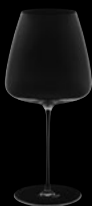
MEDEA Wine 01 76 cl 25 ¾ oz H 240 mm 9 ½" D 110 mm 4 ¼" No. 64903 0100