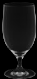
Calice birra 20 37 cl 12 ½ oz H 167 mm 6 ¾" D 80 mm 3 ¼" No. 6087 2000