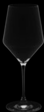
Calice vino 02

40,5 cl 13 ¼ oz H 215 mm 8 ½ " D 86 mm 3 ½ "