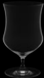
Calice Birra Stout 57 cl 19 ¼ oz H 162 mm 6 ¼" D 95 mm 3 ¾" No. 6717 1900