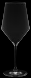
Calice vino 01 52 cl 17 3/4 oz H 230 mm 9 " D 93 mm 3 3/4 " No. 6829 0100