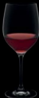
Calice vino 01 45 cl 15 1/4 oz H 220 mm 8 3/4" D 88 mm 3 1/2" No. 6050 0100