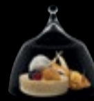
Cloche 105 H 104 mm 4 1/8 " D 110 mm 4 1/4 " No. 6719 0105