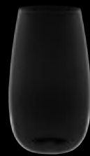
Bicchiere HB 12 58 cl 19 ½ oz H 148 mm 6" D 86 mm 3 ½" No. 62417 1200