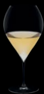
Calice vino 02