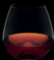
Bicchiere borgogna 10 44 cl 15 oz H 95 mm 3 3/4 " D 95 mm 3 3/4 " No. 4245 1000