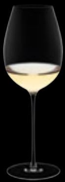
Calice vino 02 48 cl 16 ¼ oz H 240 mm 9 ½ " D 86 mm 3 ½ " No. 7661 0200