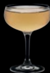
Paris Coppa champ. 28 26 cl 8 3/4 oz H 131 mm 5 1/4" D 96 mm 3 3/4" No. 6515 2800