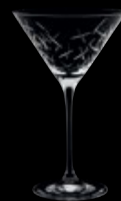
Somerset Martini 39313 21 cl 7 oz H 183 mm 7 ¼" D 112 mm 4 ½" No. 6006 H 39313