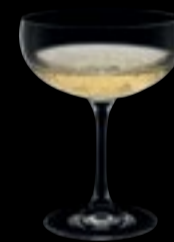
Coppa champagne 08

28 cl 9 ½ oz H 144 mm 5 ¾ " D 114 mm 4 ½ "