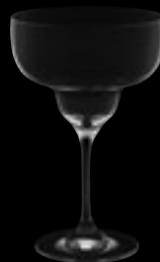
Margarita 32 34 cl 11 1/2 oz H 172 mm 6 3/4" D 111 mm 4 1/2" No. 6006 3200