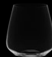
Bicchiere OF 16 49 cl 16 ½ oz H 106 mm 4 ¼ " D 98 mm 3 ¾ " No. 65856 1600

↳ Calibrazione disponibile su richiesta come indicato nel listino prezzi