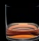
Bicchiere OF 16 37 cl 12 ½ oz H 85 mm 3 ¼" D 85 mm 3 ¼" No. 8077 H / 1600