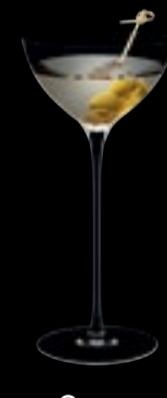
Coppa martini/cocktail 28 20 cl 6 ¾ oz H 200 mm 7 ¾ " D 95 mm 3 ¾ " No. 7662 2800