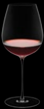
Calice vino 01 71 cl 24 oz H 240 mm 9 ½ " D 101 mm 4 " No. 7661 0100