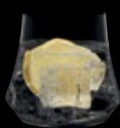
Bicchiere acqua 13 29 cl 9 3/4 oz H 80 mm 3 1/4 " D 86 mm 3 1/2 " No. 8411 1300