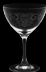
Coppa champagne intagliata 25 cl 8 1/2 oz H 144 mm 5 3/4" D 98 mm 4" No. 6515 08333