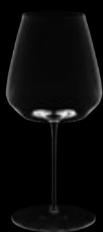
Calice vino 01 55 cl 18 ½ oz H 206 mm 8 ¼ " D 69,5 mm 2 ¾ " No. 65856 0100