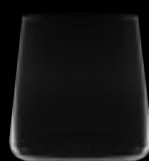
Bicchiere DOF 166