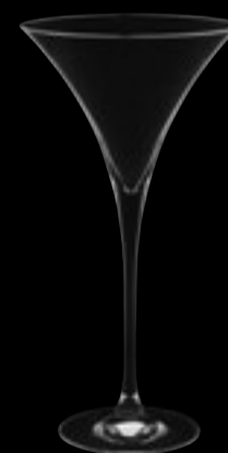
Coppa martini 28 24 cl 8 oz H 275 mm 10 ¾ " D 127 mm 5 " No. 6051 2800