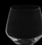
Bicchiere OF 16 39 cl 13 ¼ oz H 90 mm 3 ½" D 95 mm 3 ¾" No. 4220 1600