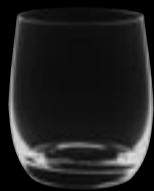
Bicchiere cocktail 15 25 cl 8 ½ oz H 90 mm 3 ½ " D 79 mm 3 ¼ " No. 4233 1500