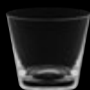
Cucina 120 13 cl 4 ½ oz H 63 mm 2 ½ " D 70 mm 2 ¾ " No. 4193 0130