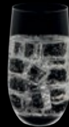
Bicchiere birra 13 35 cl 11 ¾ oz H 132 mm 5 ¼ " D 73 mm 2 ¾ " No. 4233 1300