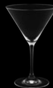
Coppa martini 28

30 cl 10 ¼ oz H 188 mm 7 ½ " D 125 mm 4 ½ "