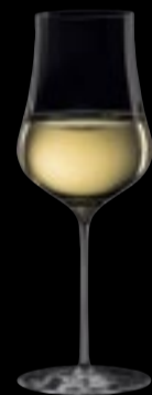
CALICE I VINI BIANCHI E ROSATI GIOVANI

52 cl 17 ¾ oz H 246 mm 9 ¾" D 92 mm 3 ¾"