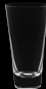
Highball 122 36 cl 12 ¼ oz H 151 mm 6 " D 78 mm 3 " No. 4836 1220