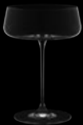
Coppa champagne 08 42,5 cl 14 1/4 oz H 170 mm 6 3/4 " D 120 mm 4 3/4 " No. 7048 0800