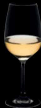
Calice vino 01 34 cl 11 1/2 oz H 205 mm 8" D 77 mm 3" No. 6339 0100