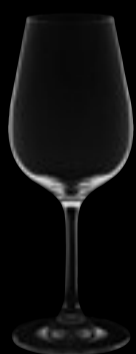
Calice vino 02

25 cl 8 ½ oz H 195 mm 7 ¾ " D 73 mm 2 ¾ "