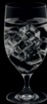
Calice acqua 20 37 cl 12 ½ oz H 167 mm 6 ¾" D 80 mm 3 ¼" No. 6087 2000