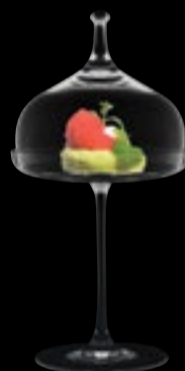
Calice + Cloche