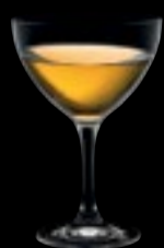
Coppa champagne 08 25 cl 8 ½ oz H 144 mm 5 ¾" D 98 mm 4" No. 6515 0800