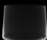
Bicchiere Bibita 19 48 cl 16 ¼ oz H 75 mm 3 " D 102 mm 4 " No. 64955 1900

— Calibrazione disponibile su richiesta come indicato nel listino prezzi