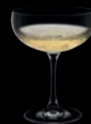
Coppa champagne 08 28 cl 9 ½ oz H 144 mm 5 ¾" D 114 mm 4 ½" No. 6200 0800