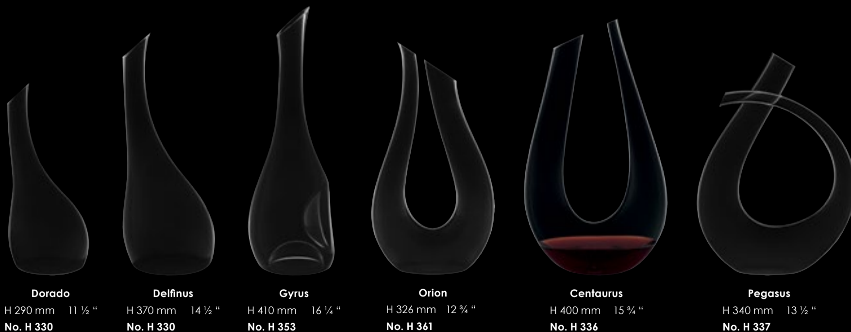
Dorado H 290 mm 11 ½ " No. H 330