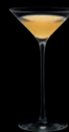
MEDEA Liqueur martini 288 4 cl 1 ¼ oz H 140 mm 5 ¼" D 75 mm 3" No. 65320 A 2880

— Calibrazione disponibile su richiesta come indicato nel listino prezzi