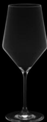
Calice vino 01

52 cl 17 ¾ oz H 230 mm 9 " D 93 mm 3 ¾ "