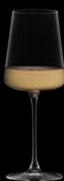
Calice vino 43

43,5 cl 15 oz H 225 mm 8 ¾" D 85 mm 3 ¼"