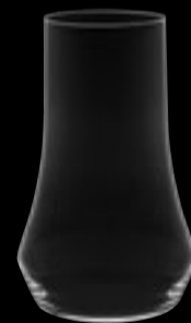
Long drink 12 48 cl 16 1/4 oz H 145 mm 5 3/4 " D 90 mm 3 1/2 " No. 8411 1200

— Calibrazione disponibile su richiesta come indicato nel listino prezzi