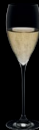
Calice flut 09