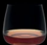
Bicchiere OF 16