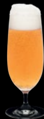
Calice birra 19 36 cl 12 ¼ oz H 184 mm 7 ¼" D 79 mm 3 ¼" No. 6006 1900