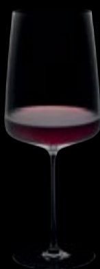
Bordeaux 00 86 cl 29 oz H 260 mm 10 ¼ " D 100 mm 4 " No. 64900 A 0000