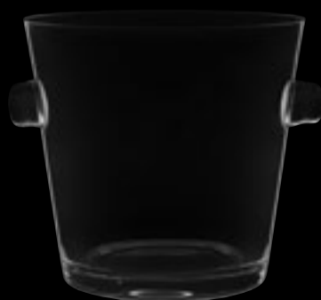
Secchiello ghiaccio 95