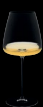
MEDEA Wine 02 54 cl 18 ¼ oz H 225 mm 8 ¾" D 98 mm 3 ¾" No. 64903 0200