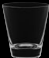
Old fashioned 16 29 cl 9 ¾ oz H 98 mm 3 ¾ " D 90 mm 3 ½ " No. 4836 1600