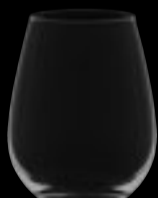
Bicchiere acqua 15 33 cl 11 1/4 oz H 100 mm 4 " D 79 mm 3 " No. 4485 1500