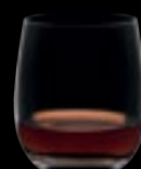
Bicchiere OF 16 36 cl 12 ¼ oz H 95 mm 3 ¾" D 84 mm 3 ¼" No. 4233 1600