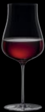
CALICE I VINI BIANCHI E ROSATI IMPORTANTI MA ANCHE ROSSI GIOVANI