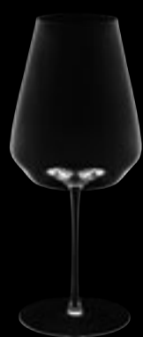
Bordeaux 00 66 cl 22 ¼ oz H 241 mm 9 ½ " D 101 mm 4 " No. 65856 0000