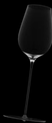
Calice Bordeaux 36

67 cl 22 ¾ oz H 295 mm 11 ½ " D 111 mm 4 ½ "