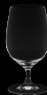
Calice acqua 11 31 cl 10 ½ oz H 150 mm 6" D 78 mm 3" No. 6050 1100

↳ Calibrazione disponibile su richiesta come indicato nel listino prezzi