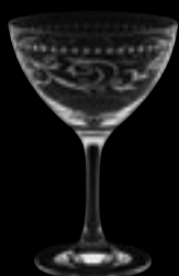
Coppa champagne satinata 25 cl 8 1/2 oz H 144 mm 5 3/4" D 98 mm 4" No. 6515 08925