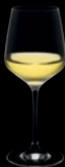
Calice vino 02

36 cl 12 ¼ oz H 210 mm 8 " D 86 mm 3 ½ "