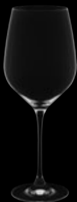
Bordeaux 00 67 cl 22 ¾ oz H 270 mm 10 ¾ " D 103 mm 4 " No. 6051 0000