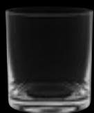
Bicchiere OF 16 28 cl 9 1/2 oz H 88 mm 3 1/2" D 80 mm 3 1/4" No. 4232 1600