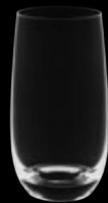
Bicchiere HB 12 49 cl 16 ½ oz H 144 mm 5 ½ " D 79 mm 3 " No. 4233 1200

— Calibrazione disponibile su richiesta come indicato nel listino prezzi