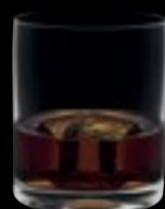
Bicchiere OF 166 39 cl 13 ¼ oz H 102 mm 3 ¾ " D 88 mm 3 ½ " No. 4232 1660