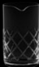
Mixer Cumberland 73

60 cl 20 ¼ oz H 146 mm 5 ¾ " D 87 mm 3 ¾ "