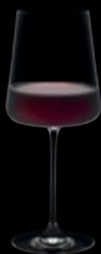
Calice vino 01