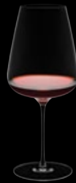
Bordeaux 00 77 cl 26 oz H 240 mm 9 ½ " D 105 mm 4 ¼ " No. 7662 0000