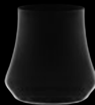
Bicchiere DOF 166 47 cl 16 oz H 98 mm 3 3/4 " D 100 mm 4 " No. 8411 1660