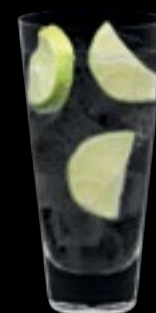
Long drink 12 39 cl 13 ¼ oz H 160 mm 6 ¼ " D 80 mm 3 ¼ " No. 4836 1200

— Calibrazione disponibile su richiesta come indicato nel listino prezzi