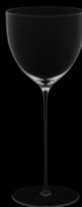
MEDEA Wine 01 45 cl 15 ¼ oz H 240 mm 9 ½" D 100 mm 4" No. 64954 0100