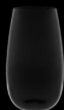
Bicchiere HB 12

58 cl 19 ½ oz H 148 mm 6 " D 86 mm 3 ½ "