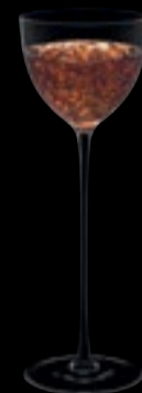
MEDEA Cordial 05 13 cl 4 ½ oz H 210 mm 8 ¼" D 72 mm 2 ¾" No. 64954 0500