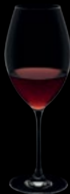
Syrah / Pinot noir 01