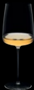
Vino 02 48 cl 16 ¼ oz H 230 mm 9 " D 86 mm 3 ½ " No. 64900 A 0200