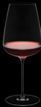
Calice vino 01 66 cl 22 ¼ oz H 240 mm 9 ½ " D 97 mm 3 ¾ " No. 7662 0100