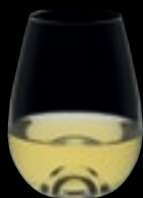
Bicchiere vino 02 33 cl 11 1/4 oz H 100 mm 4 " D 79 mm 3 " No. 4245 0200