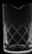
Mixer Diamond 73 60 cl 20 ¼ oz H 146 mm 5 ¾" D 87 mm 3 ¾" No. 5702 7310