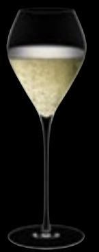
Franciacorta 09 31,5 cl 10 ¾ oz H 240 mm 9 ½ " D 84 mm 3 ¼ " No. 7662 0900

Calibrazione disponibile su richiesta come indicato nel listino prezzi