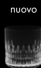
OF Kingston 16903 37 cl 12 ½ oz H 85 mm 3 ¼" D 85 mm 3 ¼" No. 8077 H 16903