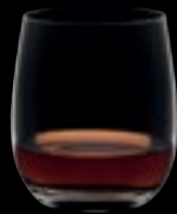
Bicchiere OF 16 36 cl 12 ¼ oz H 95 mm 3 ¾ " D 84 mm 3 ¼ " No. 4233 1600