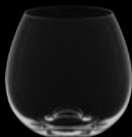
Bicchiere OF 166 54 cl 18 1/4 oz H 97 mm 3 3/4 " D 102 mm 4 " No. 4245 1660