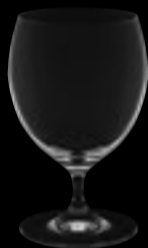
Calice Birra Ale 60 cl 20 ¼ oz H 158 mm 6 ⅛" D 102 mm 3 ⅝" No. 6716 1900