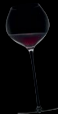
Calice Borgogna 38

73 cl 24 ¾ oz H 270 mm 10 ½ " D 112 mm 4 ½ "