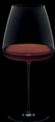
MEDEA Bordeaux 00 89 cl 30 oz H 255 mm 10" D 115 mm 4 ½" No. 64903 0000