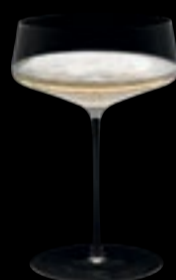
Coppa Champagne 08 54 cl 18 ¼ oz H 180 mm 7 " D 123 mm 4 ¾ " No. 64900 A 0800