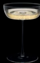
Coppa Champagne 08 23 cl 7 ¾ oz H 152 mm 6 " D 106 mm 4 ¼ " No. 65856 0800