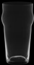
Pinta 63 cl 21 ¼ oz H 162 mm 6 ¼" D 90 mm 3 ½" No. 4822 1900

parte integrante della cultura di ogni popolo