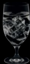
Calice acqua 20 37 cl 12 ½ oz H 167 mm 6 ¾" D 80 mm 3 ¼" No. 6087 2000