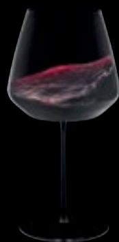
Borgogna 10 68 cl 23 oz H 220 mm 8 ½ " D 111 mm 4 ½ " No. 65856 1000