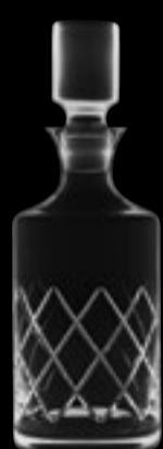
Whisky Decanter 73 75 cl 25 ¼ oz H 273 mm 10 ¾" D 100 mm 4" No. 63659 F 7376