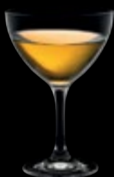
Coppa champagne 08 25 cl 8 1/2 oz H 144 mm 5 3/4" D 98 mm 4" No. 6515 0800