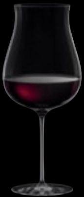
CALICE I VINI ROSSI DA VITIGNI A BASSO IMPATTO COLORANTE

110 cl 37 ¼ oz H 275 mm 10 ¾" D 116 mm 4 ½"