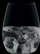
Mix Drink 122 47 cl 16 oz H 112 mm 4 1/2 " D 87 mm 3 1/2 " No. 4485 1220

— Calibrazione disponibile su richiesta come indicato nel listino prezzi