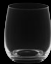
Bicchiere OF 166 46 cl 15 ½ oz H 103 mm 4 " D 90 mm 3 ½ " No. 4233 1660