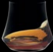
Bicchiere OF 16 38 cl 12 3/4 oz H 88 mm 3 1/2 " D 94 mm 3 3/4 " No. 8411 1600