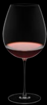
Bordeaux 00 89 cl 30 oz H 240 mm 9 ½ " D 110 mm 4 ¼ " No. 7661 0000