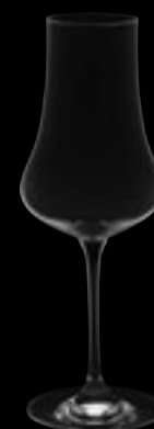
Bicchiere per Distillati di Frutta 35