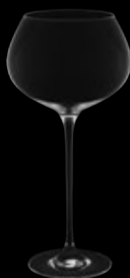
Borgogna 36 73 cl 24 ¾ oz H 260 mm 10 ¼ " D 124 mm 5 " No. 6051 3600