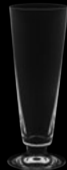
Bicchiere birra 19 38 cl 12 3/4 oz H 203 mm 8" D 75 mm 3" No. 7238 1900