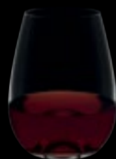
Bicchiere bordeaux 00 46 cl 15 1/2 oz H 112 mm 4 1/2 " D 87 mm 3 1/2 " No. 4245 0000