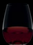
Bicchieri bordeaux 00