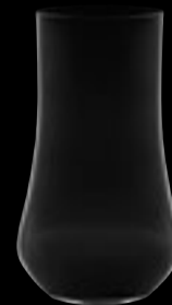
Juice tumbler 14 36 cl 12 1/4 oz H 130 mm 5 " D 76 mm 3 " No. 8411 1400