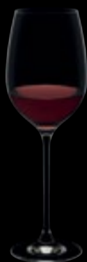
Calice vino 01 46 cl 15 ½ oz H 255 mm 10 " D 85 mm 3 ½ " No. 6051 0100