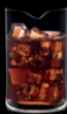
Mixer 73 60 cl 20 ¼ oz H 146 mm 5 ¾" D 87 mm 3 ¾" No. 5702 7300