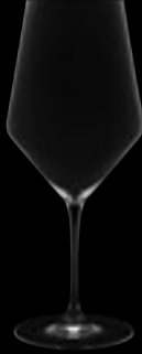
Bordeaux 00 64 cl 21 3/4 oz H 240 mm 9 1/2 " D 100 mm 4 " No. 6829 0000